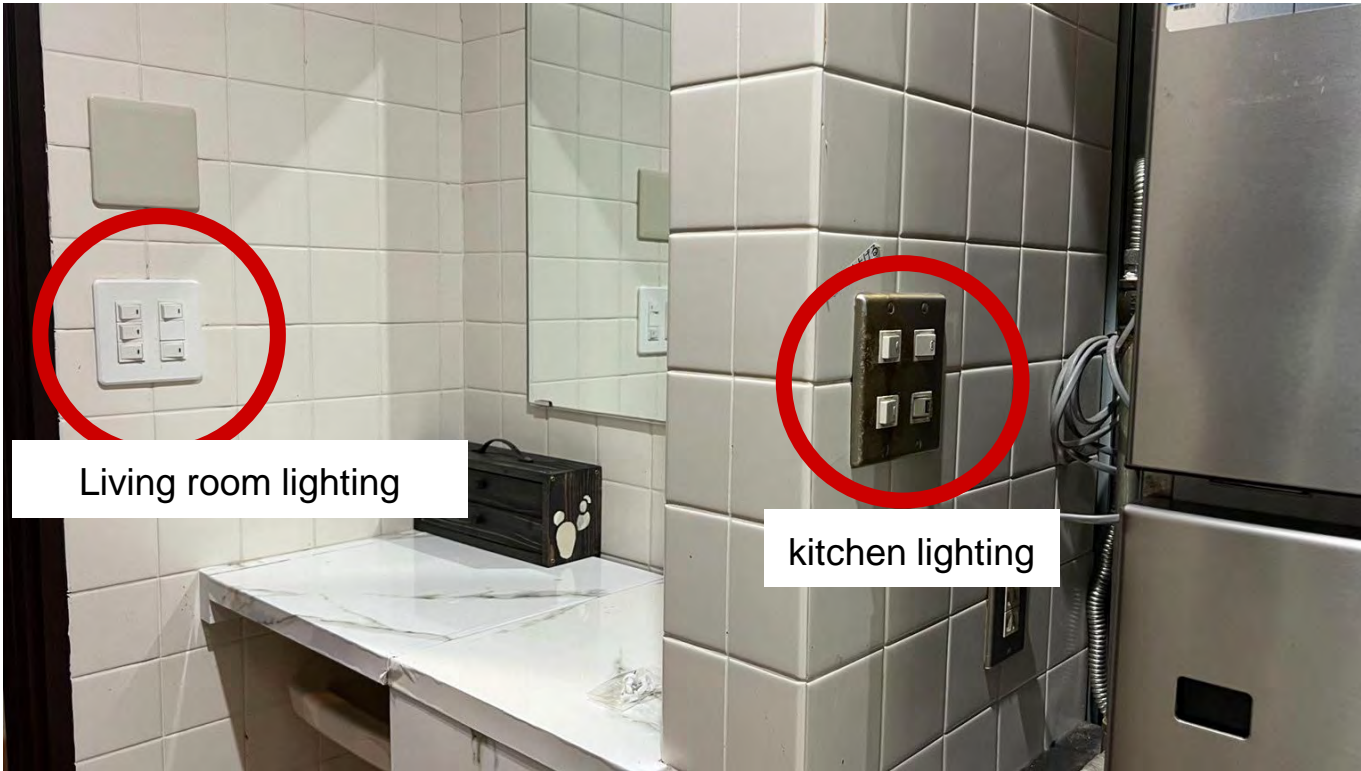
Living room lighting